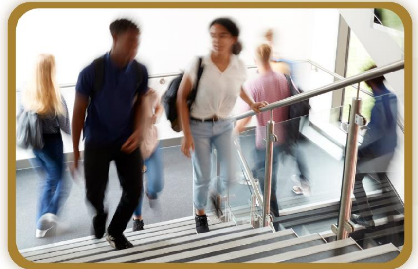
Figura 10. Oraciones con la estructura gramatical “acababa de + infinitivo”.